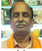
माही टॉयज बैंगलोर