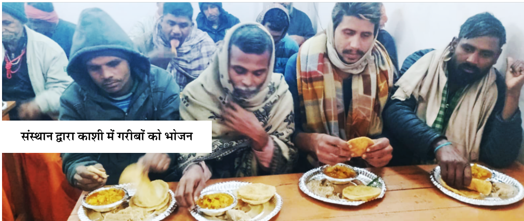
संस्थान द्वारा काशी में गरीबों को भोजन

कहते हैं कि भूखे को भोजन करवाकर न सिर्फ मन वरन् अंतरात्मा भी संतुष्ट होती है। आप भी