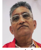
ऋषभ ज्वेल्स बैंगलोर